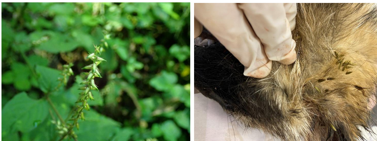
図2. 最も多くの動物種から種子が回収されたイノコヅチ。左は植物体に種子が結実している状態。右は種子がタヌキの遺体の体毛に付着している様子。