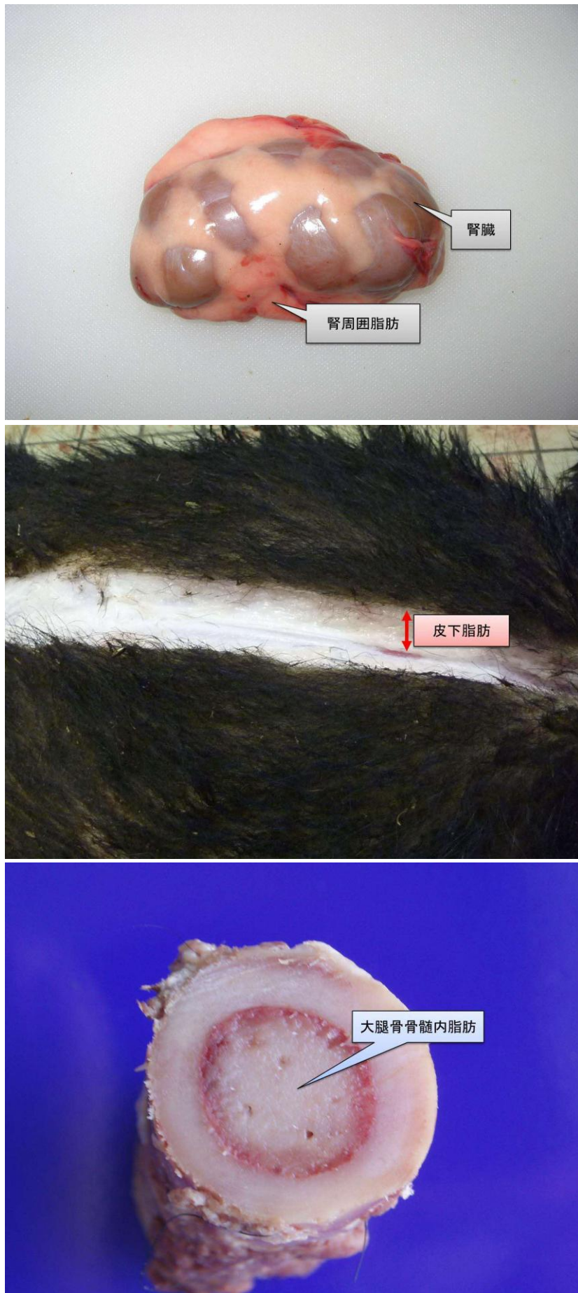
図1：上から測定に用いたツキノワグマの内臓脂肪（修正腎周囲脂肪指数）、皮下脂肪、骨髓脂肪（大腿骨骨髓内脂肪）の一例。